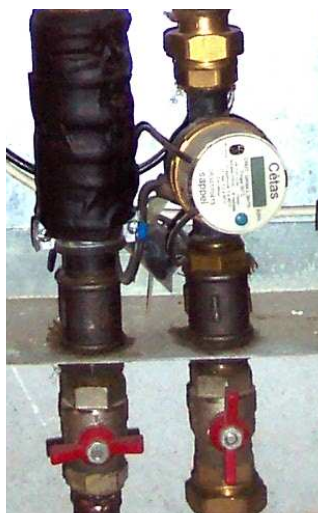
Compteur de chaleur